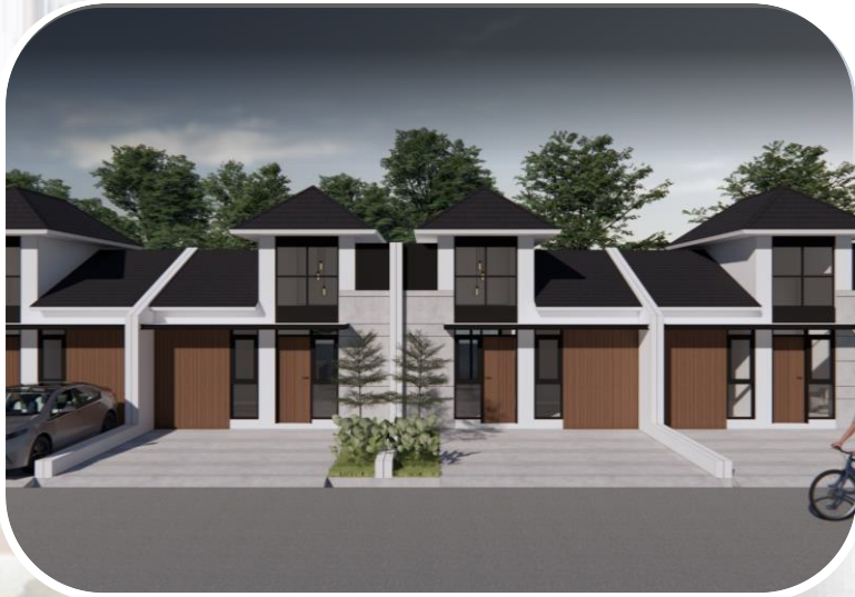
Tipe RS 36/81 Natura Limas