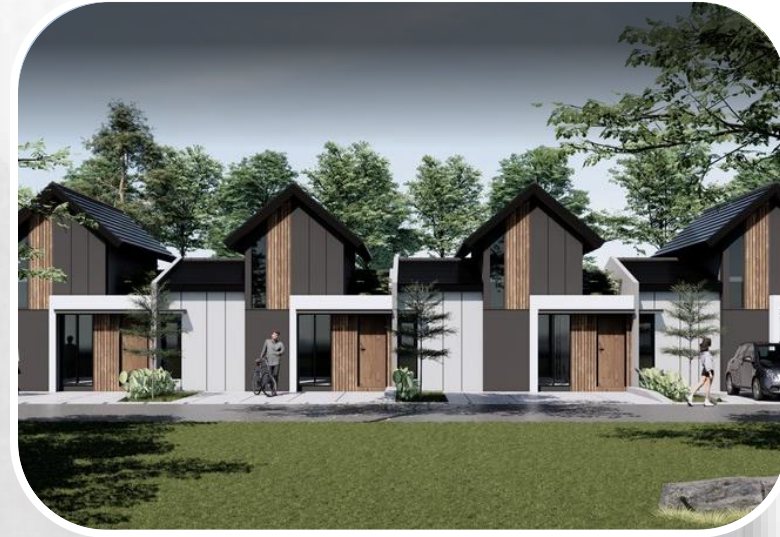
Tipe RS 45/94,5 Eboni Tropika

komposisi menyesuaikan perubahan siteplan, kondisi lapangan, dll